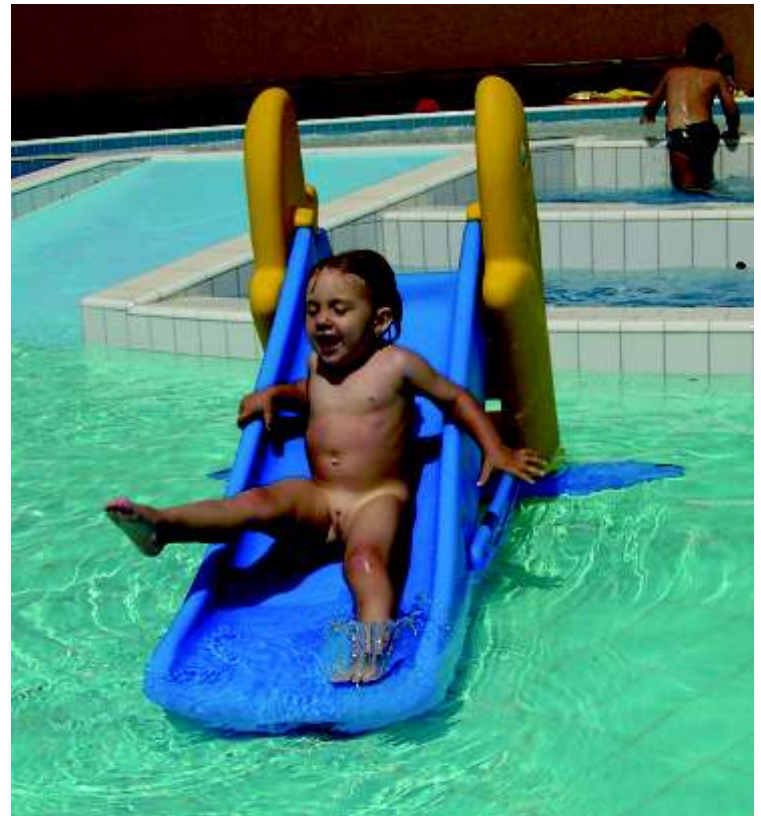
Malá návštěvnicka si užívá atrakci v bazénu určeném pro děti. Oprava celého areálu po povodni stála skoro 25 milionů korun.

Mnohem hůře skončilo po povodních druhé děčínské venkovní koupaliště - Pod zámek. Areál zůstane letos zavřený. Povodně tu zničily bazény, sociální zařízení i kemp. Část zeminy byla kontaminovaná a radnice ji musela